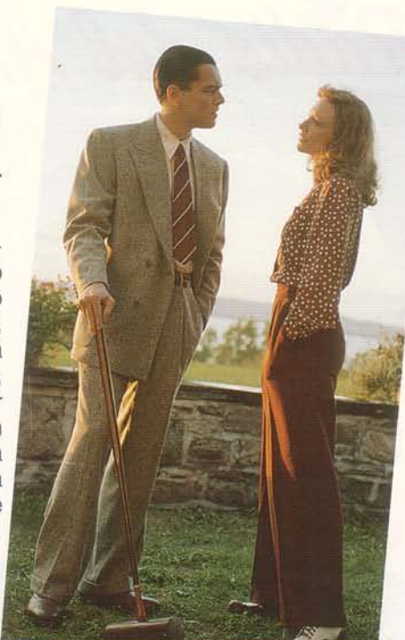
Leo con Cate Blanchett, quien da vida a la inolvidable Katharine Hepburn.