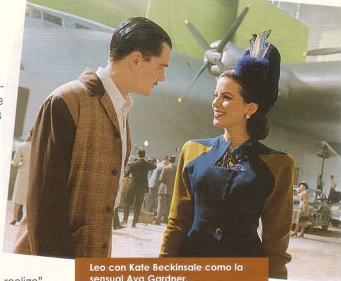
Leo con Kate Beckinsale como la sensual Ava Gardner.

"Es que promover una película es una parte de lo que un actor debe hacer para que la gente aprecie el trabajo que uno realiza".