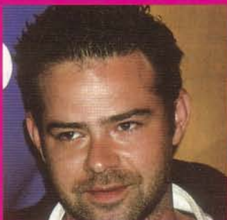
Con Rory Cochrane casi cuatro. A él lo vimos en la serie C.S.I. Miami como el policía 'Speedie'.