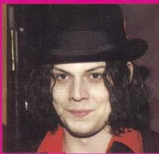
Con Jack White no paso del segundo año. Es el líder de la banda 'The White Stripes'.