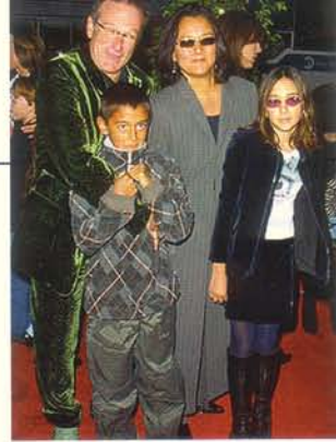
Con su segunda esposa y sus hijos.

Bailar en hielo. Artísticamente, me gusta la escultura. Como actor, un musical que sea chistoso.