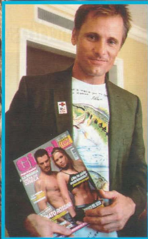
El con la revista y al costado como el personaje del Señor de los anillos.

Desde Los Angeles entrevista exclusiva con 'Argorn' de la trilogía 'El señor de los anillos'