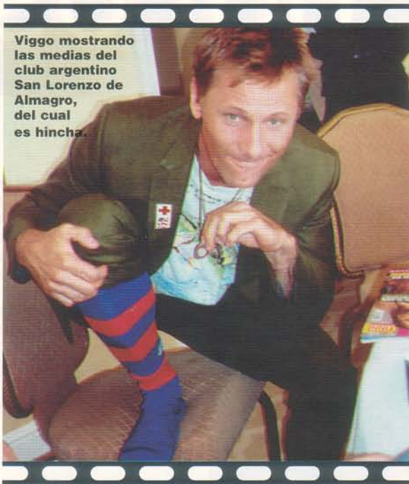
Viggo mostrando las medias del club argentino San Lorenzo de Almagro, del cual es hincha.

“Sí, siempre traigo algo, cosas que expresan mi manera de ser o que me hacen sentir cómodo. Y si yo no lo uso o no lo usan en el set, lo guardo en mi trailer u hotel. Puede tratarse de ropa, objetos o cosas que me dan buena suerte. Para esta película, algunas decoraciones en el comedor del set son cosas mías”